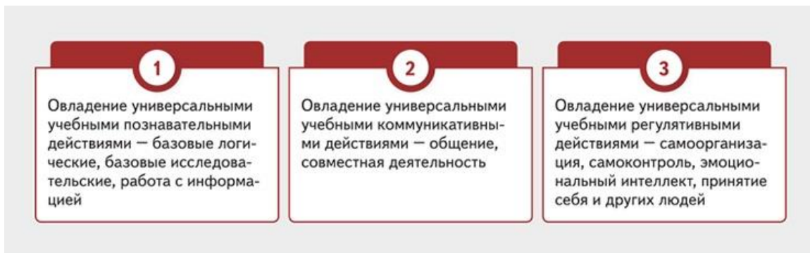
Рисунок. Три направления метапредметных результатов в обновленном ФГОС СОО