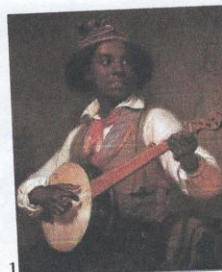
1. Фото художника, 1870 2. В. Васнецов. Портрет художника, 1869 3. И. Крамской. Портрет художника, 1872