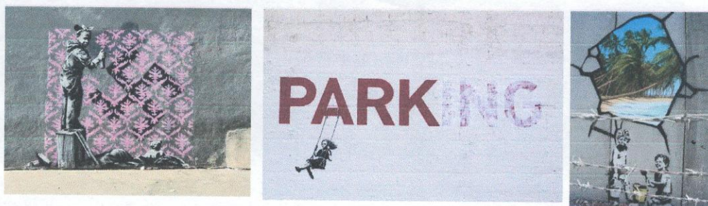
Изобразительный ряд и текст к заданию 7